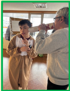
伝言ゲーム よ〜く聞いてね