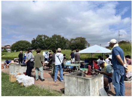
暑い中、かまど担当のお父さん達 お疲れ様でした！

思わず水に入りたくなって、日傘も手放せない、そんな陽気の中→バーベキューを楽しみました。メンバーも親たちもボラさんも、みんな大いに食べ・飲み・遊びました。そして、最後は河川敷のゴミ拾い。傘・吸い殻・シャンプー容器など短時間でもたくさん見つけ、ゴミのポイ捨てはいけなことを学びました。