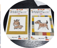
年賀状も日本文化。賛助会員の皆さま届きましたか?