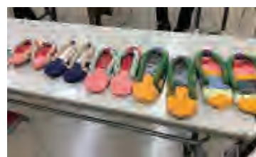
~委員の方より~ ご自宅で作成した布ぞうりを披露してくださいました。